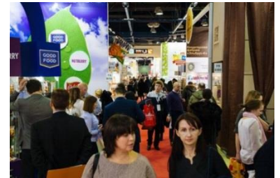
▲昨年のプロド・エキスポ展示会